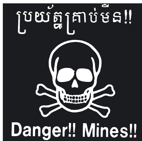
Minenwarnschild aus Kambodscha