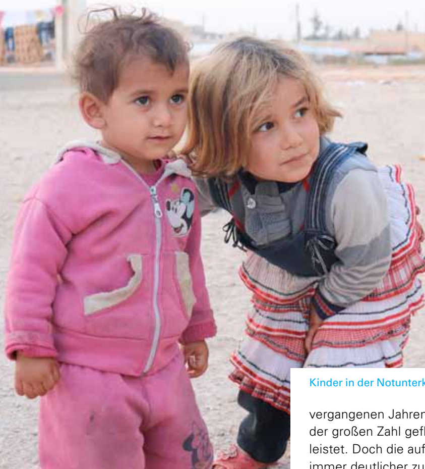
Kinder in der Notunterkunft Jibreen am Rand von Aleppo.

vergangenen Jahren Großes bei der Versorgung der großen Zahl geflüchteter Menschen geleistet. Doch die aufnehmenden Länder geben immer deutlicher zu verstehen, dass ihre Kapazitäten zu helfen an eine Grenze gekommen sind. Im Libanon ist heute jeder vierte Einwohner ein syrischer Flüchtling. Der Druck auf die Wasserversorgung ist im wasserarmen Jordanien sehr groß. Es ist bemerkenswert, dass es trotz der