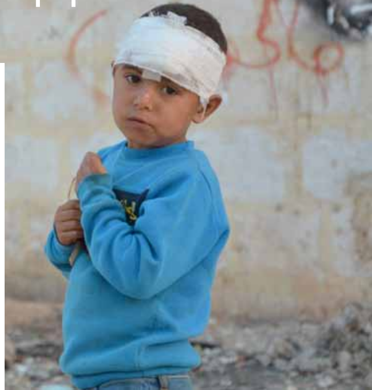
Verletzter Junge in Aleppo.

In Folge der veränderten Sicherheitslage sind 2017 rund 720.000 Menschen in ihre Heimatregion in Syrien zurückgekehrt (2016: 560.000). Die Voraussetzungen für eine sichere und nachhaltige Rückkehr sind nach Einschätzung der UN jedoch in weiten Teilen des Landes nicht gegeben. Gleichzeitig wurden vor allem im Norden des Landes Zehntausende Menschen neu vertrieben. Insgesamt waren innerhalb Syriens