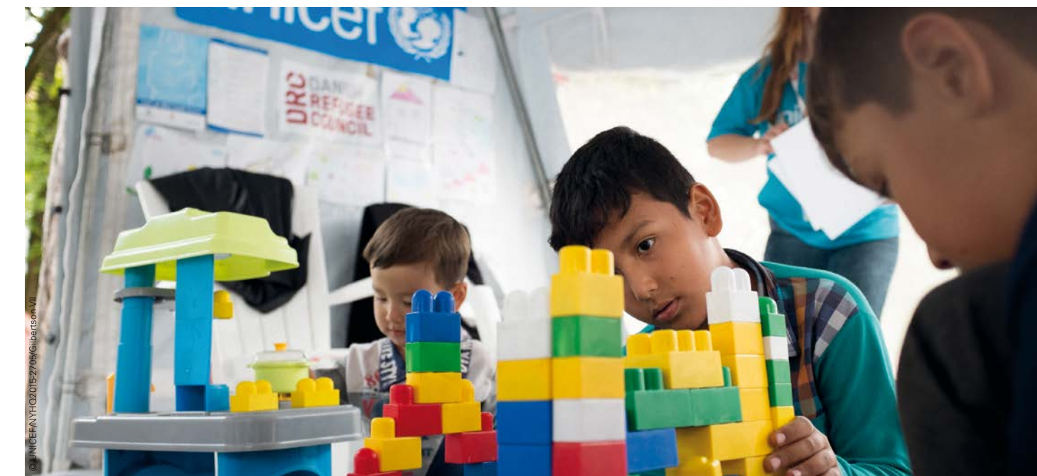
Psychosoziale Betreuung und Spielmöglichkeiten in Kinderzelten von UNICEF geben den Flüchtlingskindern Halt.