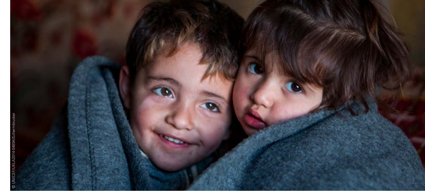
Warm eingepackt: Schlafdecken, Kleidung und Heizmaterial gehören zu den Hilfsgütern, die Ihre Spende möglich macht.

In Syrien und der Region können die Temperaturen bis unter den Gefrierpunkt sinken.