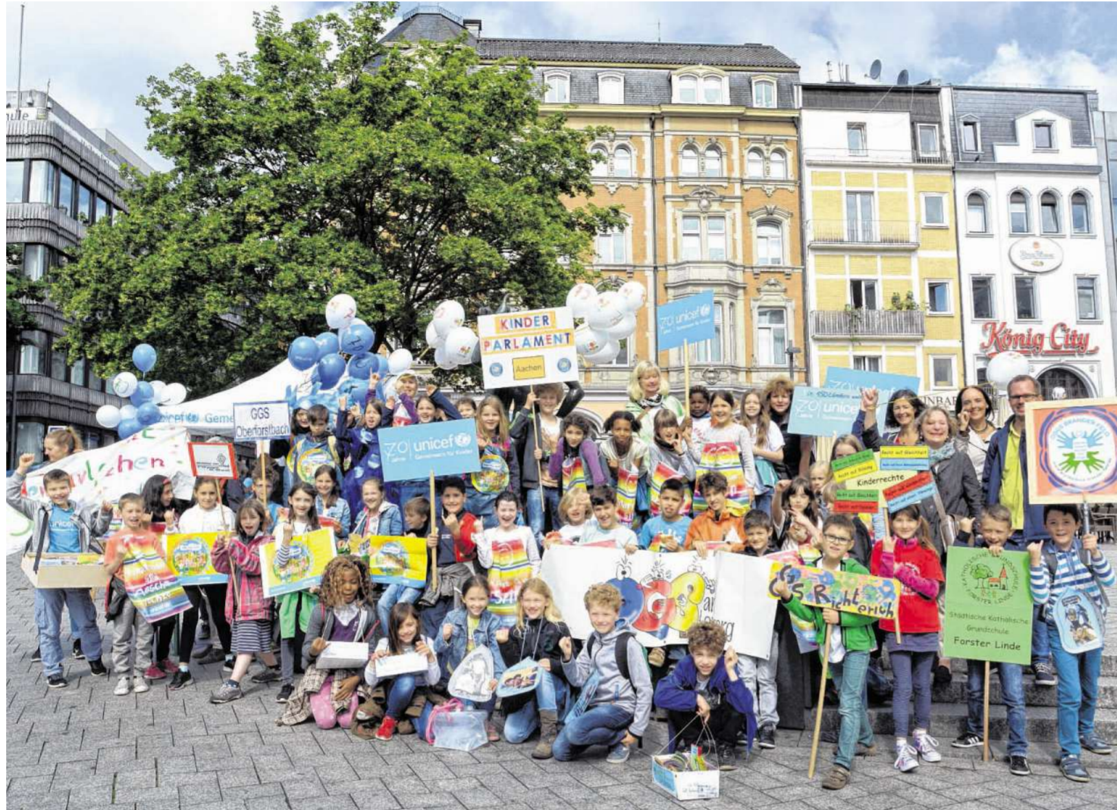
Bunter Demonstrationszug durch die Innenstadt: Rund 60 Abgeordnete des Kinderparlaments warben gestern anlässlich des 70. Geburtstags des Kinderhilfswerks Unicef für Kinderrechte.