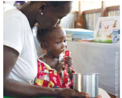
Mit Spezialnahrung kommt sie zu Kräften.