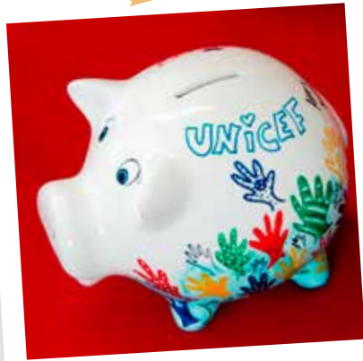
Til, 11 Jahre

UNICEF Deutschland hat Geburtstag – seit 60 Jahren engagieren sich Menschen für Kinder weltweit. Mach mit bei der Geburtstagsaktion und mach Kindern ein Geschenk, das ihr Leben retten kann!