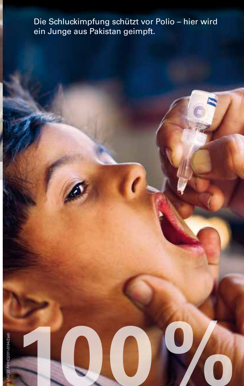
Die Schluckimpfung schützt vor Polio – hier wird ein Junge aus Pakistan geimpft.