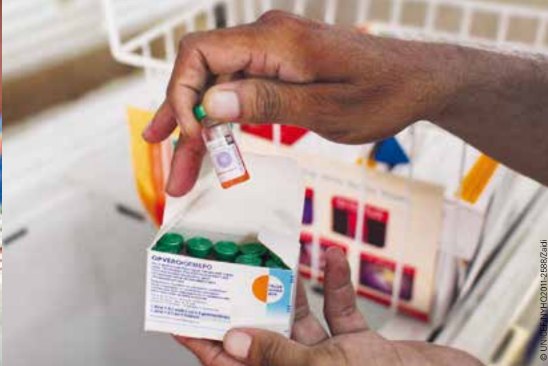
UNICEF versorgt weltweit jedes dritte Kind mit Impfstoffen – Ihre Hilfe macht das erst möglich.