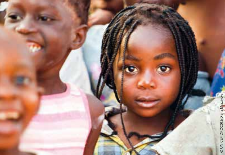
Nie mehr Polio: Damit auch hier in Kalemie, Demokratische Republik Kongo, bald kein Kind mehr erkrankt.