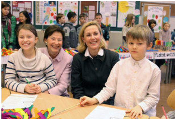
UNICEF-Schirmherrin Bettina Wulff ruft zur Beteiligung am JuniorBotschafter-Wettbewerb 2011 auf.

Startet ein Projekt und setzt Euch mit mutigen Aktionen und kreativen Ideen für die Rechte von Kindern ein.