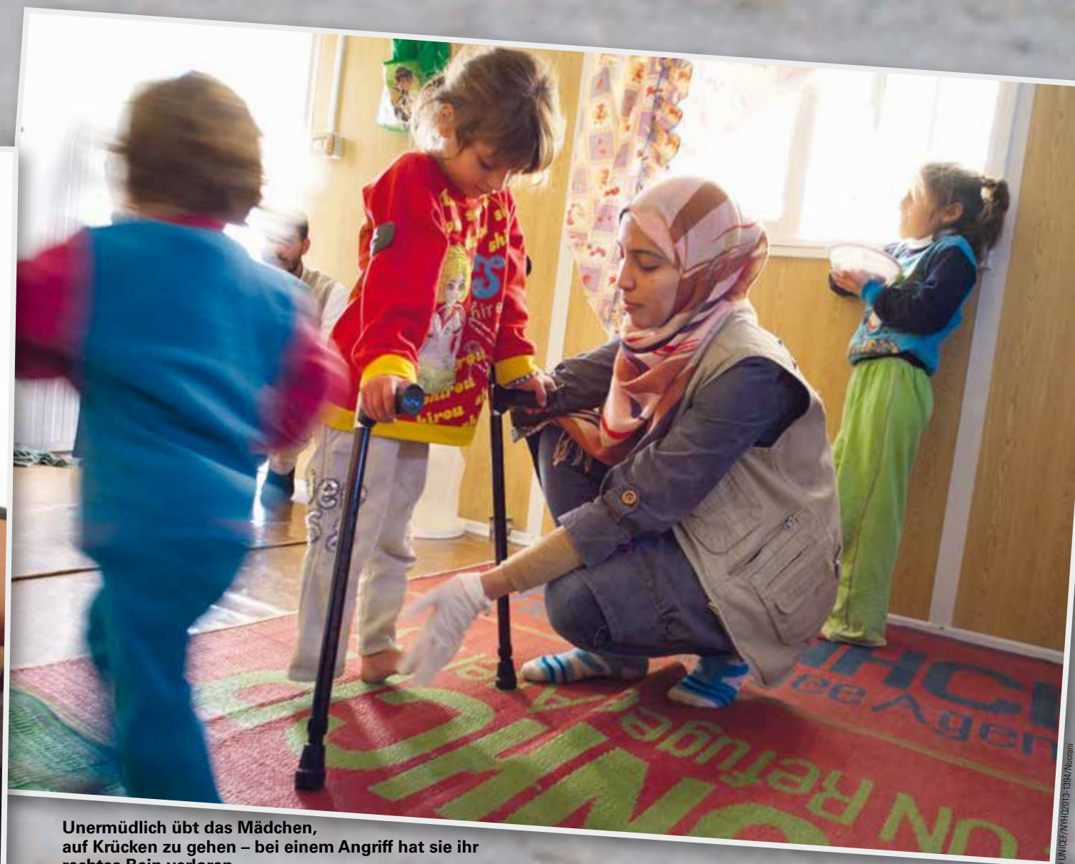
Unermüdlich übt das Mädchen, auf Krücken zu gehen – bei einem Angriff hat sie ihr rechtes Bein verloren