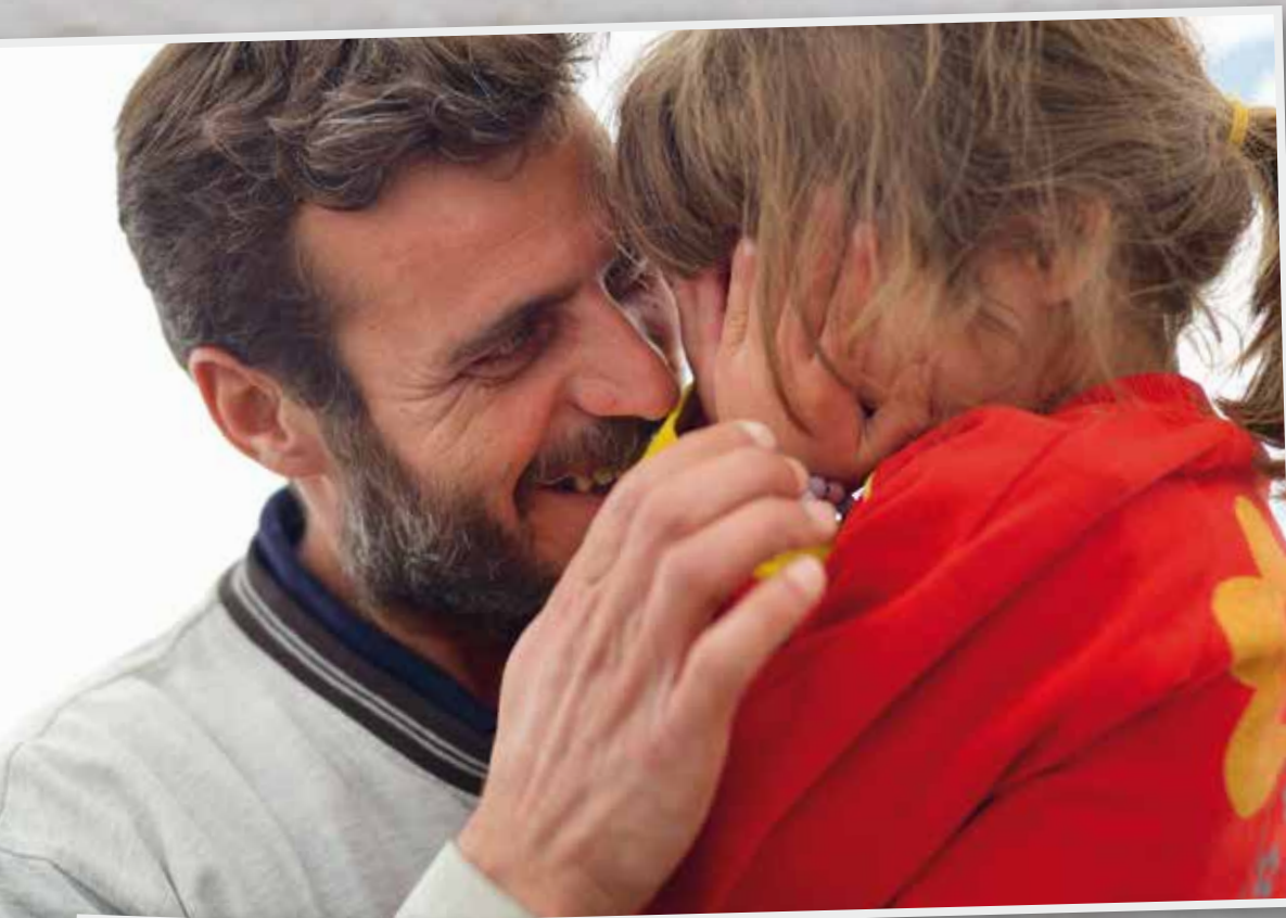
Safas Vater ist überglücklich, dass die Familie nach aller Qual in Sicherheit ist