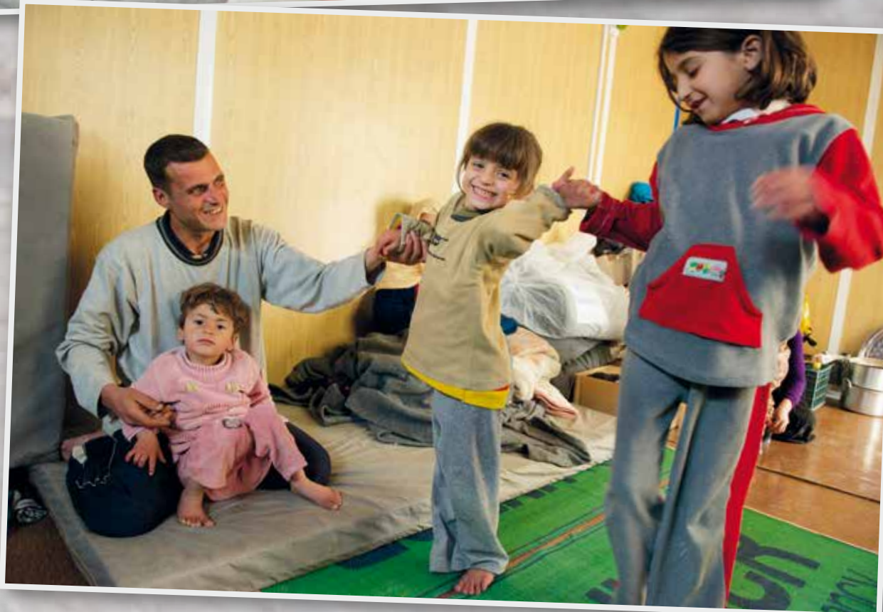
Im UNICEF-Kinderzentrum kann Safa spielen und einfach Kind sein